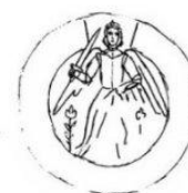
Odtlačok okrúhlej pečate obce